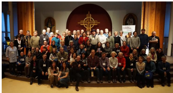
Les visages souriants des 80 personnes ayant reçu leur Credencial sur place