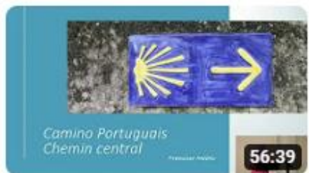
Camino Portugais, Chemin central

(Vous pouvez cliquer sur les images ci-après)