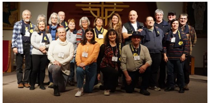
L'équipe des bénévoles qui ont organisé et animé cette journée

Autant de thèmes autour desquels les participants ont eu l'occasion d'échanger et parfois, de trouver des réponses ou à tout le moins, de poursuivre leur réflexion personnelle. Trois témoignages livrés par des personnes ayant récemment parcouru un chemin ont été présentés aux participants. Un sur le thème du « lâcher prise » face aux éléments qu'on ne peut contrôler, une leçon souvent apprise sur le chemin de Compostelle. Une seconde présentation a vanté l'accueil extraordinaire de nos amis Bretons puis, une présentation portant sur l'alimentation a complété cette section.