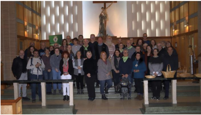
Un total de 43 visages réjouis

Merci à tous les bénévoles qui, par leur implication, ont permis aux participants d'avoir une formidable journée.