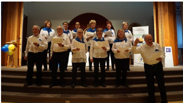
La chorale Chant libre a interprété le célèbre « Ultreïa »