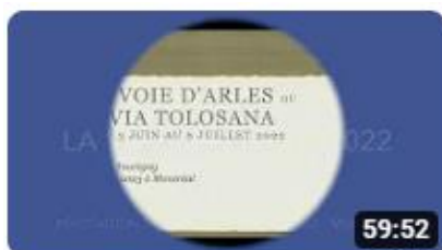
La Voie d'Arles par Lise Tourigny