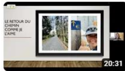
Sur le chemin portugais par Emmanuelle April Arcand

Pour avoir accès à toutes les présentations offertes par votre Association, utilisez le lien suivant :